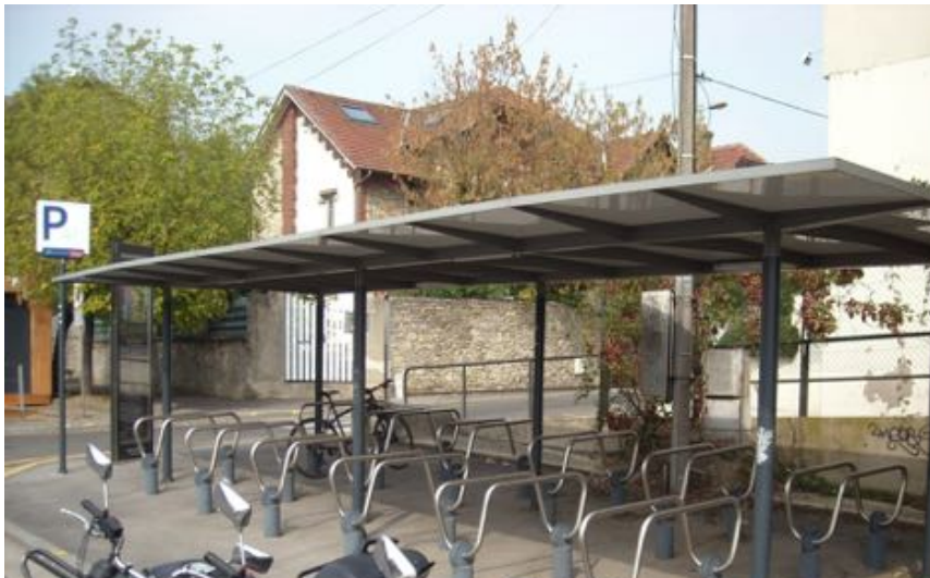
Abri vélo gare transilien