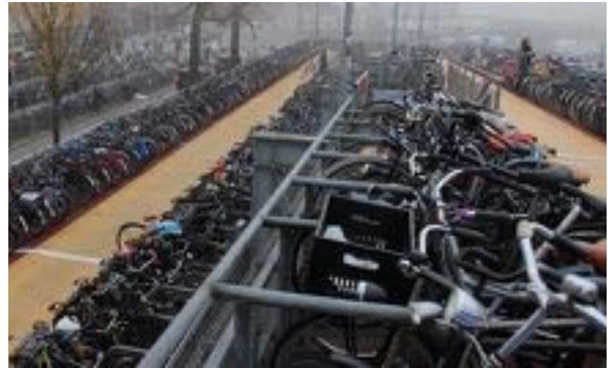
Parking vélo, Amsterdam