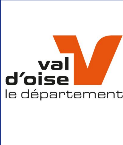
Équipement de 4 collèves valdoisiens avec la solution Jexplore