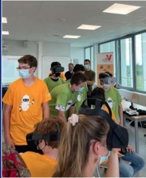
Événement VOBOT au Collège Louise Weiss à Cormeilles