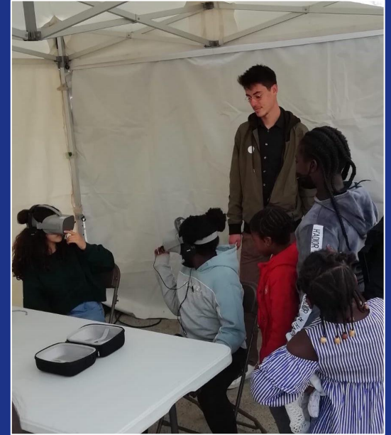
Creative Factory - Journée de l'ESS à Garges-les-Gonesse